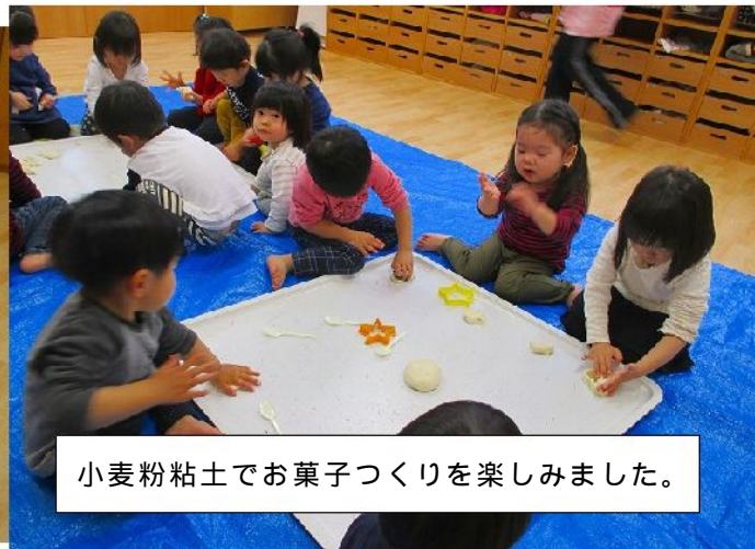
小麦粉粘土でお菓子づくりを楽しみました。